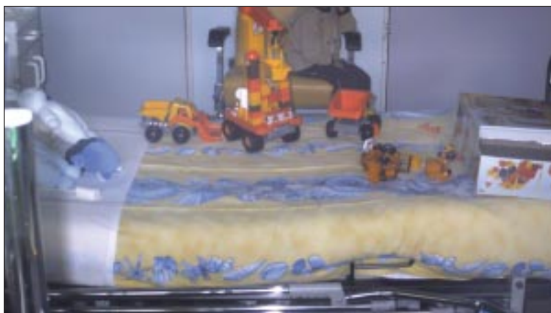
Nouvelles couleurs au Sce Hyperprotégé