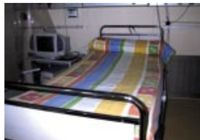
Nouvelles couleurs au Sce Hyperprotégé