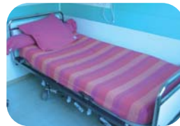
Draps de couleurs dans les chambres d'hôpital