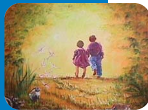
Fresque réalisée dans le service hématologie