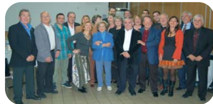
Remise de chèque de la Troupe Pierrots Lien