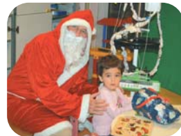
Noël à l'hôpital