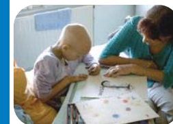
Animation au chevet de l'enfant malade cours d'arts plastiques.

Créée en 1988 à Montpellier par quelques parents directement concernés qui avaient choisi de venir en aide morale et matériellement à des personnes devant faire face aux mêmes épreuves. En étroite collaboration avec le personnel du service oncologie de l'hôpital pédiatrique CHU de Montpellier.