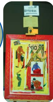
Tableau offert pour la tombola du Festival Taurin