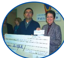
Remise de chèque du Club Taurin Paul Ricard